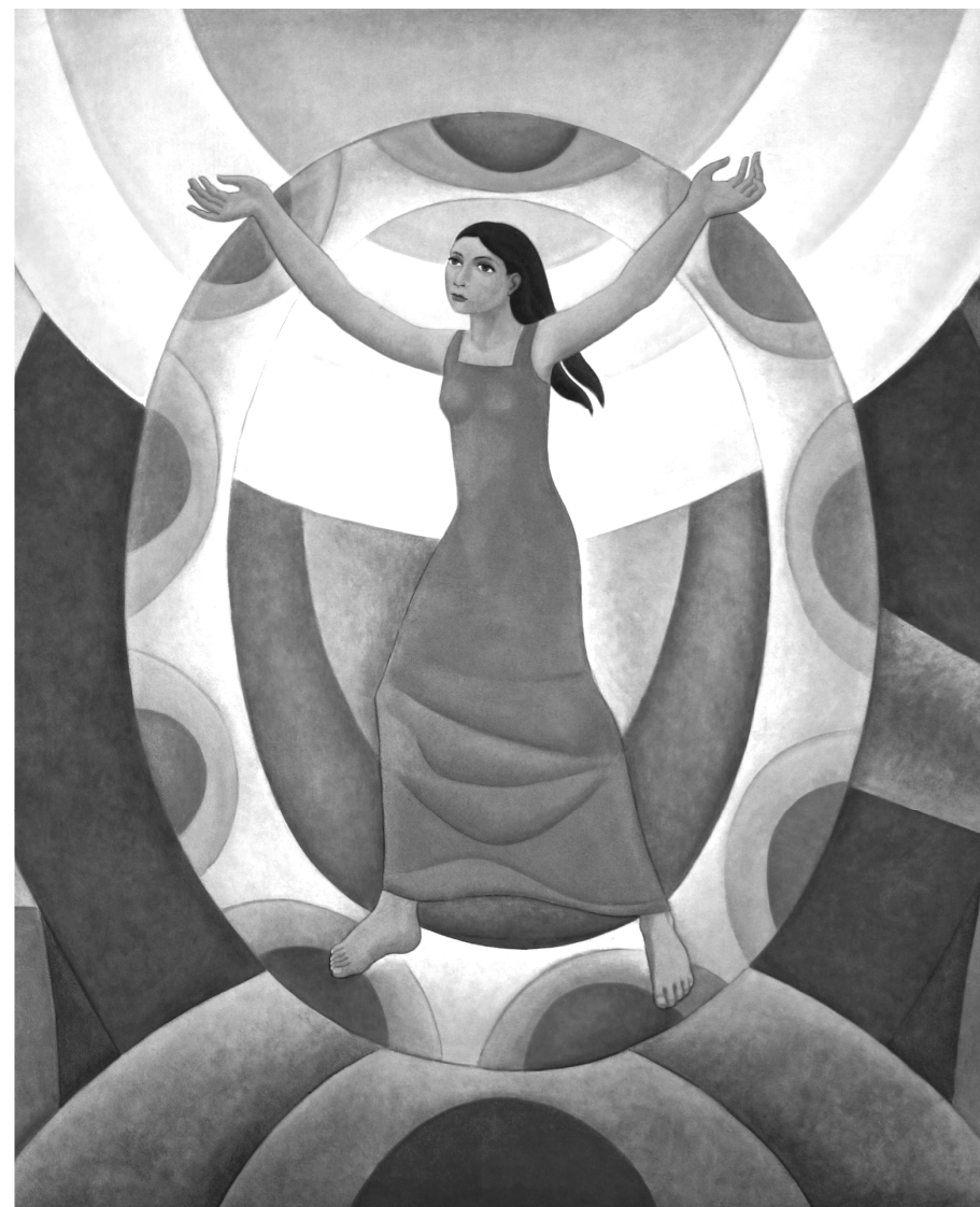
Maria del Magnificat - murales a Luciara/Mato Grosso - Brasile (particolare)

Ha soccorso Israele, suo servo, ricordandosi della sua misericordia, come aveva promesso ai nostri padri, ad Abramo e alla sua discendenza per sempre.